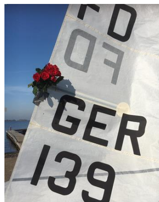
Jupp in zijn karakteristieke pose in de FD.