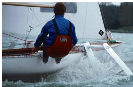
De FD was z'n tijd ver voorruit !